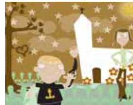
Illustrasjon: Line Jerner

«Barn trenger tydelige foreldre som hjelper dem å ta kloke valg. Du kan ikke abdisere fra foreldrerollen til å bli en kul kamerat med barnet ditt. Husk at de fleste barn innerst inne ser på foreldrene sine som helter.» (Stein Erik Ulvund, Forstå barnet ditt 8-12 år)