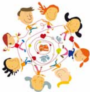
Illustrasjon: Elisabeth Moseng

Barna vil kunne velge mellom ulike grupper: Kor, dans, KRIK og teknolab. Vi vil ha fellessamlinger i løpet av dagen og avslutter med å invitere familie og venner til avslutningsshow.