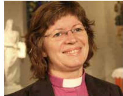
Ingeborg Midttømme er biskop i Møre bispedømme.