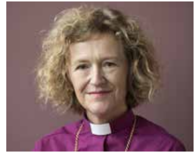
Kari Veiteberg er biskop i Oslo bispedømme.