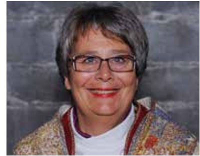
Solveig Fiske er biskop i Hamar bispedømme.