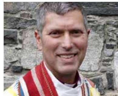
Ivar Braut er biskop i Stavanger bispedømme.