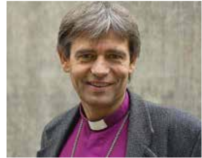
Stein Reinertsen er biskop i Agder og Telemark bispedømme.