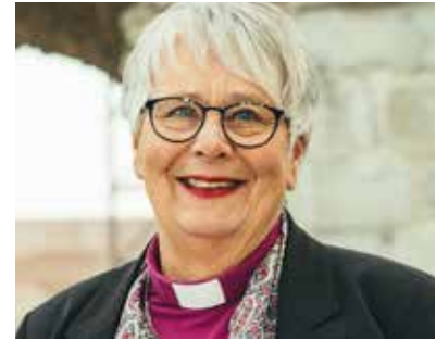
Solveig Fiske er biskop i Hamar bispedømme.