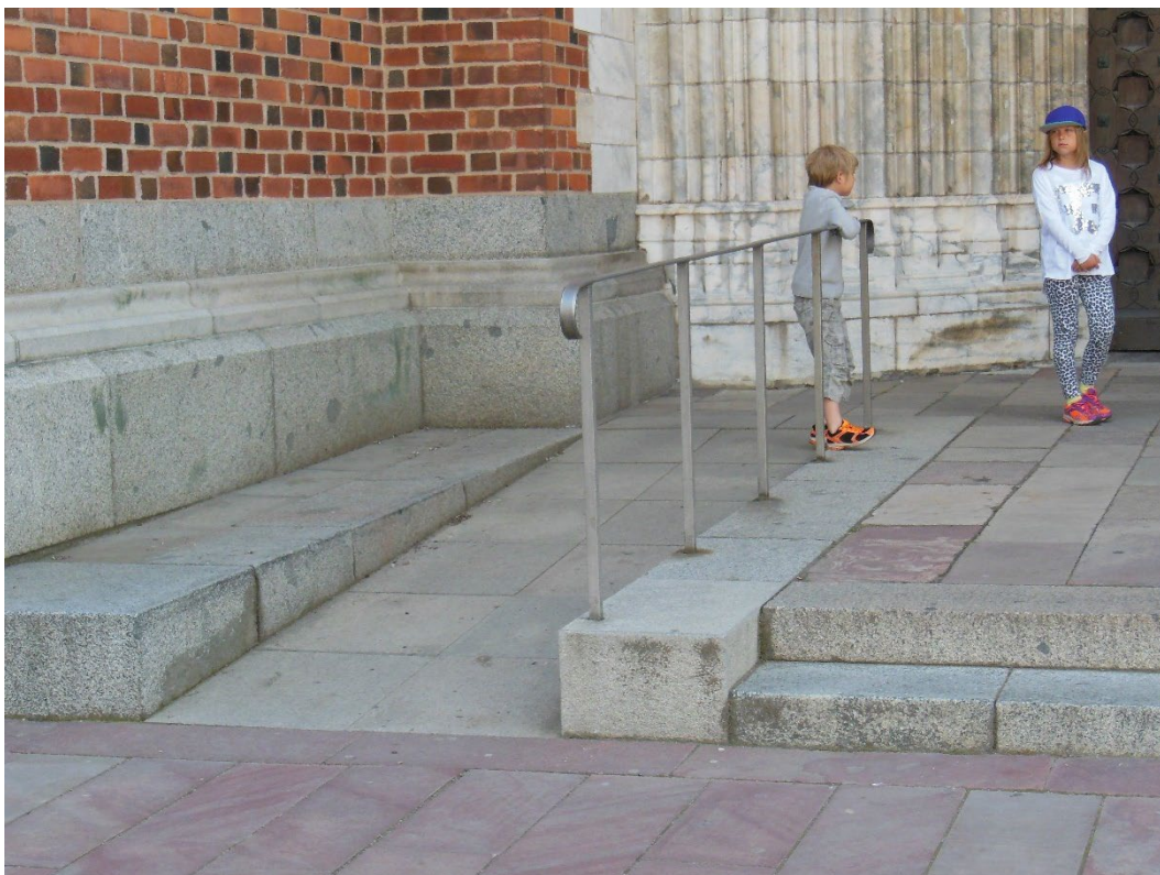
BILDE: Innfelt rampe i en stor, ny trapp.