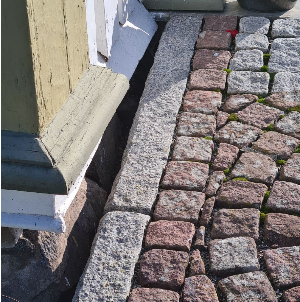
BILDE: Det er viktig å etablere en effektiv avrenning mellom forhøyningen og kirkeveggen. Vann, snø og is som legger seg inntil treverk, forårsaker lett råte.

Terrenghevingen utenfor døren må være så stor at den tillater en god bevegelsesradius, og avrenningen må være merket eller sikret slik at ingen snubler i den.