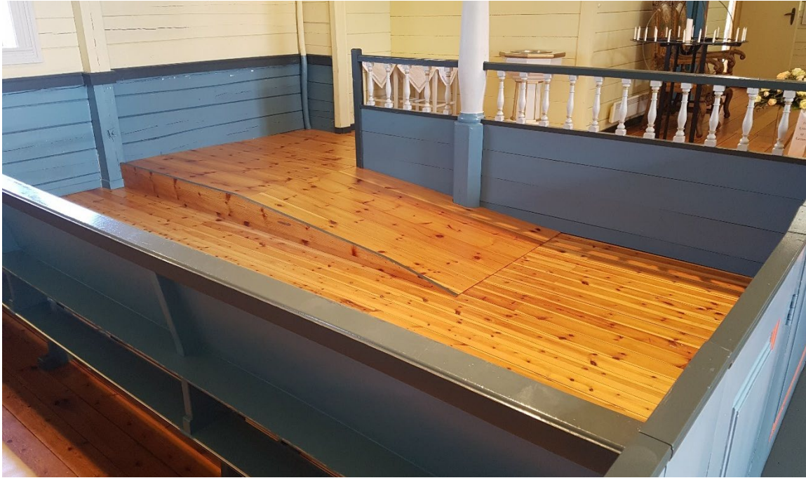
BILDE: Her har man fått en solid og samtidig diskret rampe i en kirke med lukkede benker. En benk er fjernet og døren er tilpasset bredden av en rullestol.