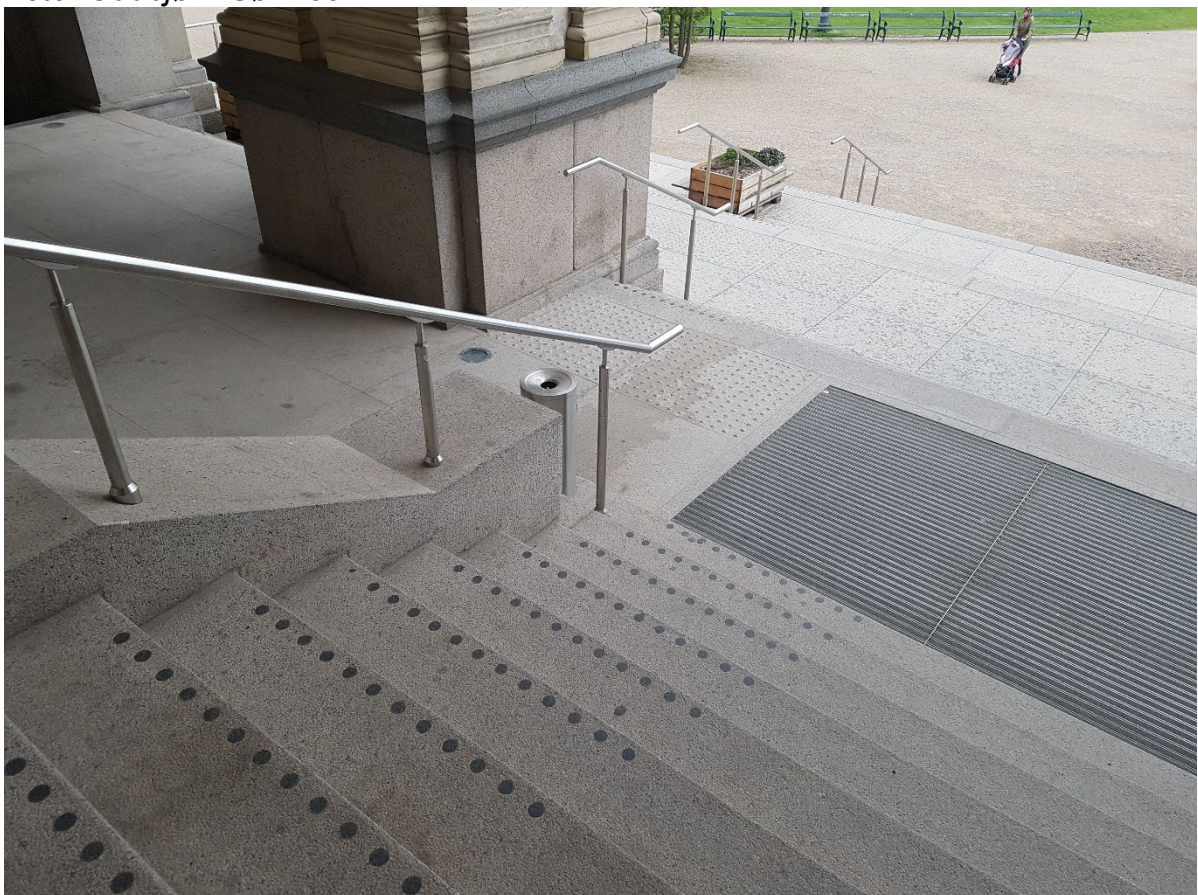
BILDE: Kontrastsylindrene er her lagt til området nær håndløperen. Håndløperen er ikke bare for de som er dårlig til bens, men fungerer også som en ledelinje for blinde og svaksynte. Legg merke til at håndløperen begynner før trinnet, slik at man får en fast ledelinje allerede før første trinn. Dette forhindrer at noen snubler eller mister balansen i trinnet.