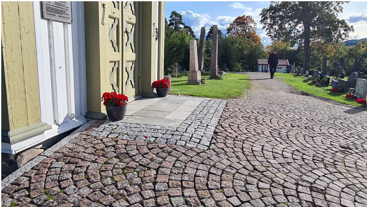
BILDE: Ved å heve terrenget har man her fått en trinnfri inngang uten rampe. Nivået utenfor døren må være så stort at rullestolen kan manøvreres uten å skli bakover.

Hvis trappen er lav, er det naturlig å forsøke å heve terrenget, eller legge en rampe opp til inngangsnivået. Er trappen så høy at det ikke lar seg gjøre, vil løsningen ofte bli å etablere en trinnfri inngang et annet sted på bygget. Er det ikke mulig å komme inn samme hoveddør fra utsiden, er det nest beste i alle fall å komme inn i kirkerommet gjennom samme dør. I så fall må noen komme inn i våpenhuset gjennom en sidedør, dit rampen eller heisen leder. I noen tilfeller blir løsningen med «sidedøren» så god at den blir en likeordnet inngang. Poenget med universell utforming er mest mulig likhet uten spesielløsninger.