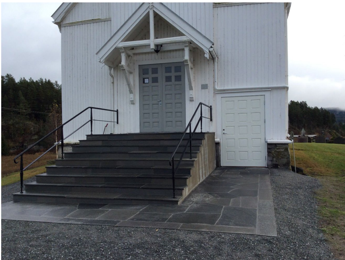
BILDE: Å lage tilpasninger for bedring av tilgjengelighet er ofte «det muligens kunst». Her er en situasjon der en rampe ville vært praktisk umulig. Et innendørs, frostsikkert løftebrett er lagt bak døren til høyre for trappen.