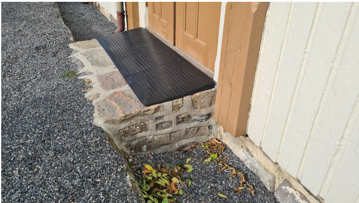
BILDE: I mange tilfeller kan tersklene mellom våpenhuset og kirkerommet forseres ved at man etablerer kiler på hver side, slik at terskelen i praksis blir trinnfri.