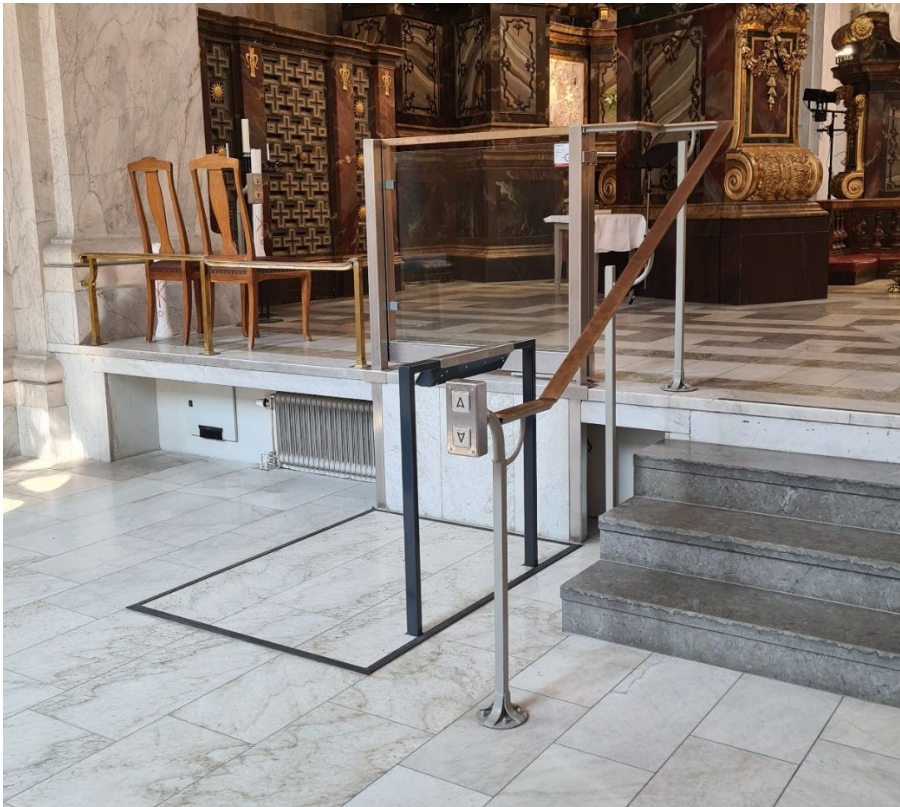
BILDE: Dette løftebrettet er til bruk inne. Det er fullstendig integrert i gulvflaten når det ikke er i bruk. Når en person befinner seg på selve brettflaten og man trykker på igangsettingsknappen, løftes en kant automatisk opp og hindrer at personer triller utenfor heisflaten.