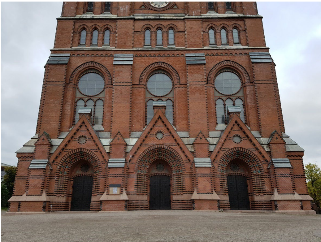
BILDE: Her er det fylt opp med hardpakket grus for å unngå en rampe. Kirkens steinsokkel er mer robust når det gjelder fuktproblemer.

I byer har det vært relativt vanlig med brostein, mens det rundt bygdekirkene har vært mer vanlig med gressbakke. Alle steder har det vært brukt hardpakket grus. Det finnes for eksempel flatskårne brosteiner som opprettholder brosteinskarakteren samtidig som den gjør det behagelig for rullestoler, vogner og rullatorer. Gressmatter kan forsterkes slik at de blir faste å kjøre på. Hovedmålet er et dekke med tilstrekkelig fasthet, som er tilpasset stedets karakter.