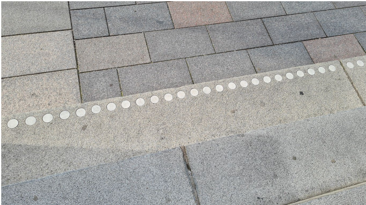
BILDE: Her er kontrastsylindrene bare felt inn i nederste trinn. For en svaksynt kan resten av trinnene dermed fremstå som én flate, slik at trinnene blir vanskelige å se.