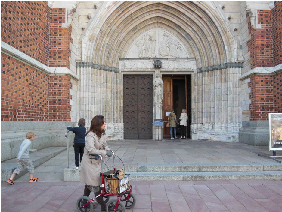
BILDE: Her har dimensjonene gjort det mulig å felle inn rampen i en stor, ny trapp.