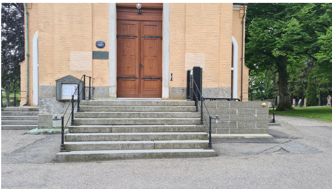
BILDE: Her er et utvendig løftebrettet skjult bak en mur med tilnærmet samme farge som kirkens egen sokkel. Klimaet gjør det mulig å montere dette på utsiden av kirken.