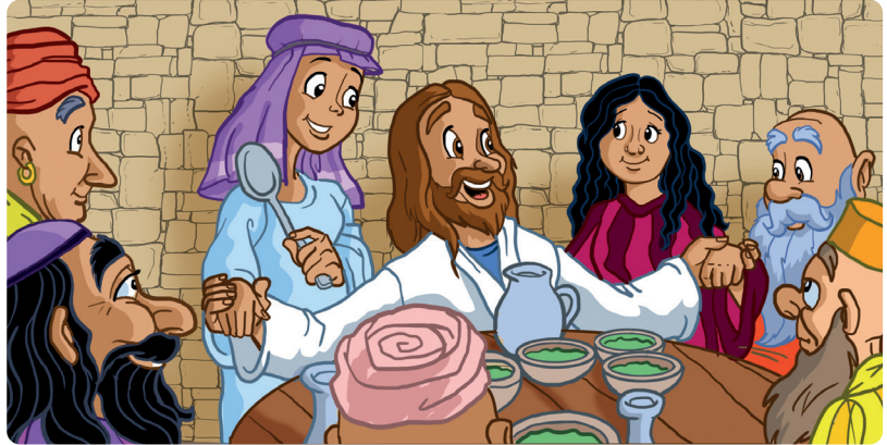
Tegning: TREVOR KEEN

De to bildene er nesten like. Finner du de fem feilene på bildet under?